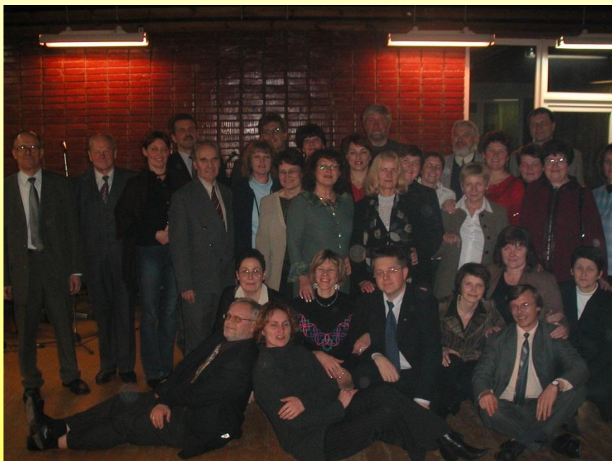
Mokyklų lyderiai – 1