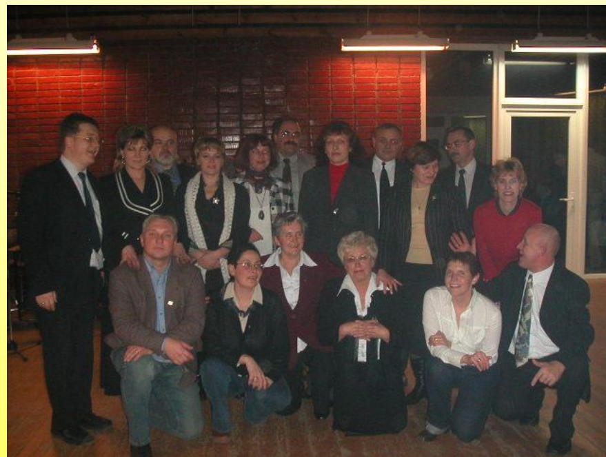
Mokyklų lyderiai – 2